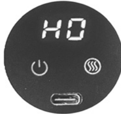
Heizmodus nicht aktiviert