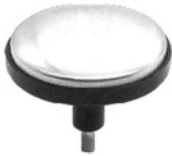
Heizkopf (zur Beruhigung steifer, schmerzender Muskeln)