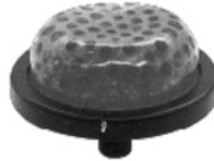
Kalter Kopf (bei Gelenkschwellungen und Muskelentzündungen)