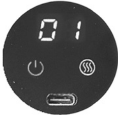
Anzeige ausgewählter Modus